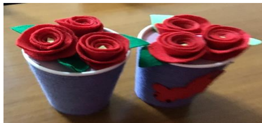
いくおクラフト作品