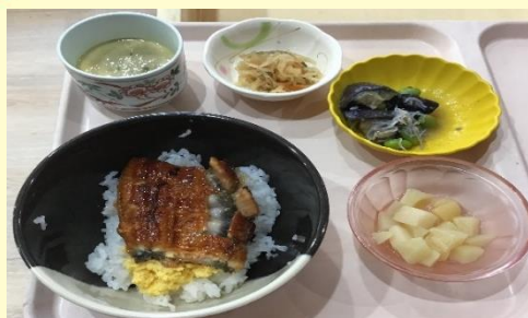
お食事が「idea food style」に変更となりました